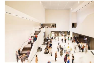
13_Besucher im Foyer