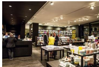
10_Der Museumsshop