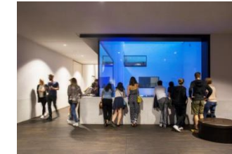
17_Blick in den Patio