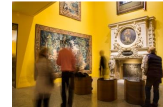
23_Barocker Kamin in der Sammlung