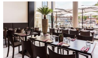
12_Das Museumscafé LUX