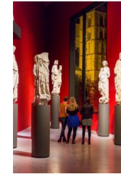
19_In der Spitze des Museums