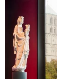
21_Die Madonna in der Spitze