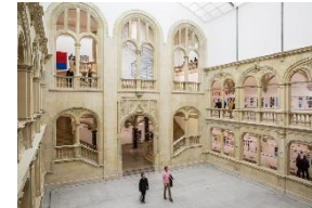
16_Blick in den Lichthof im Altbau des Museums