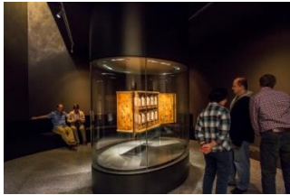
28_Kabinettschrank, sogenannter Wrangelschrank, 1566