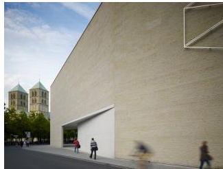
4_Blick auf Spitze und Dom von der Pferddegasse