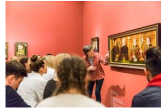
30_Besucher während einer Führung im Museum