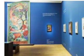
22_August Macke ist im LWL- Museum ein eigener Ausstellungsraum gewidmet.