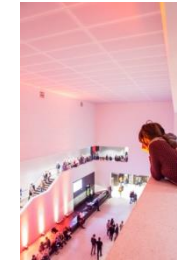
14_Lichtnacht im Foyer