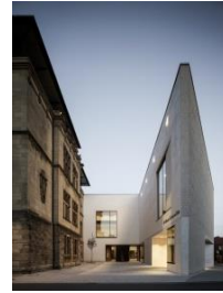
3_Altbau und Spitze