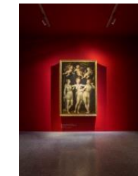
24_„Die drei Grazien“ von Dirk de Quade van Ravesteyn