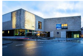
8_Museum am Abend mit der „Silbernen Frequenz“ von Otto Piene