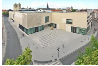
1_Blick auf das Museum