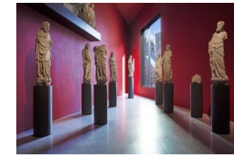
20_Die Überwasserskulpturen in der Spitze des Museums