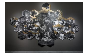
27_Der „Comic-Altar“ von Anke Feuchtenberger