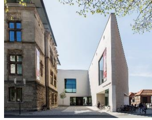
2_Altbau und Spitze am Domplatz