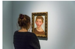
33_Besucherin in der Sammlung