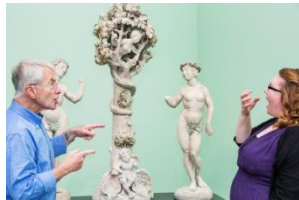
31_Führungen in Gebärdensprache