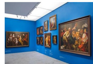
25_Blick in die Sammlung Barock