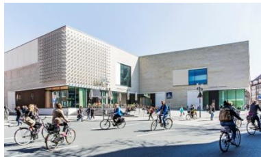
7_Südfassade des Museums