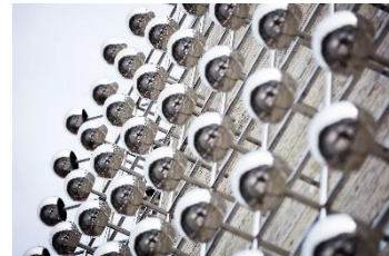
9_„Silberne Frequenz“ von Otto Piene (Detail)