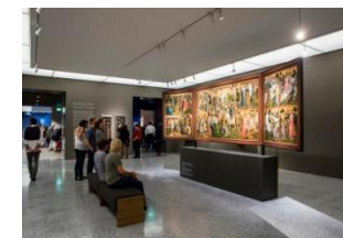
26_Besucher in der Sammlung