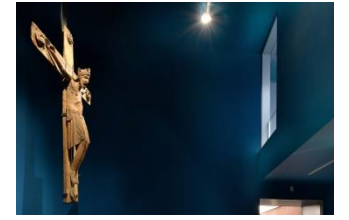
18_Bockhorster Triumphkreuz, Ende 12. Jahrhundert