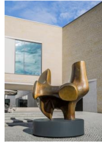
6_Henry Moore, Three Way Piece No. 2 (The Archer) © Reproduced by permission of The Henry Moore Foundation