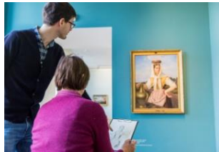
34_Zeichenworkshop für Erwachsene