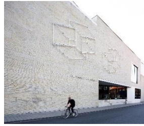
5_Josef Albers „Supraporten“ an der Museumsfassade