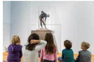
32_Führungen für Kinder